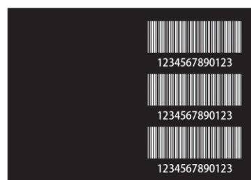
リボンセービング有り