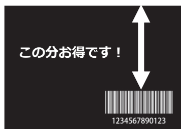
リボンセービング無し